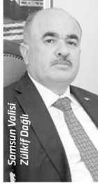
Samsun Valisi Zülkif Dağlı

mızı yapıyoruz. Otellerimiz buna kendilerini hazırladı. Kültür ve Turizm Müdürlüğümüz, TÜRSAB yetkililerimiz hazırlıklarını yaptı. Çevre ve şehirle ilgili hazırlıklar yapılıyor" dedi.